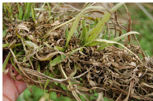
Hampefrø klar til høst.

Interessen for hampefrø skyldes hampefrøenes og -kagens høje indhold af aminosyrerne methionin, cystin, threonin m.fl. Hampefrø udgør dermed en potentiel højværdiproteinkilde for især svin og fjerkræ. Dertil kommer at hampeolien indeholder høje andele af højværdifedtsyrer som omega 3 og 6 m.fl., som gør olien interessant til human ernæring. Den fornyede interesse for hamp i Danmark skyldes ikke mindst jagten på økologisk protein, i forbindelse med udfasning af konventionel protein i den økologiske husdyrproduktion. Trods en stor interesse for hamp har kun få avlere dyrket hamp til modenhed, og årsagen er ikke mindst usikkerhed mht. modning af hampefrøet samt valg af høstteknik til bjergning af modne frø. I udlandet dyrkes ca. 50.000 ton hampefrø på årsbasis (2008). Hoveparten dyrkes i Canada og EU (ca. 20.000 tons). I EU er det Frankrig og Tyskland, der er de største producenter af hampefrø.